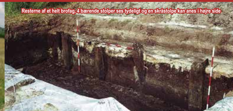
Resterne af et helt brofag, 4 bærende stolper ses tydeligt og en skråstolpe kan anes i højre side