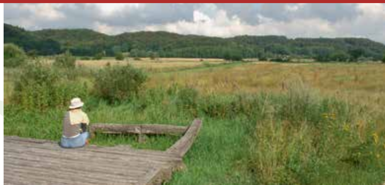
Rekonstruktionen på sydsiden, med udsigt over ådalen mod nord.

erosionskløfter på nord- og sydsiden af ådalen dannede et naturligt fundament for broen. Broens placering på et bredt sted i ådalen har også gjort den stabil overfor vand- og ispres. Desuden ved vi, at der siden jernalderen har været vejforbindelse og vade-sted tværs over ådalen her lidt vest for broen.